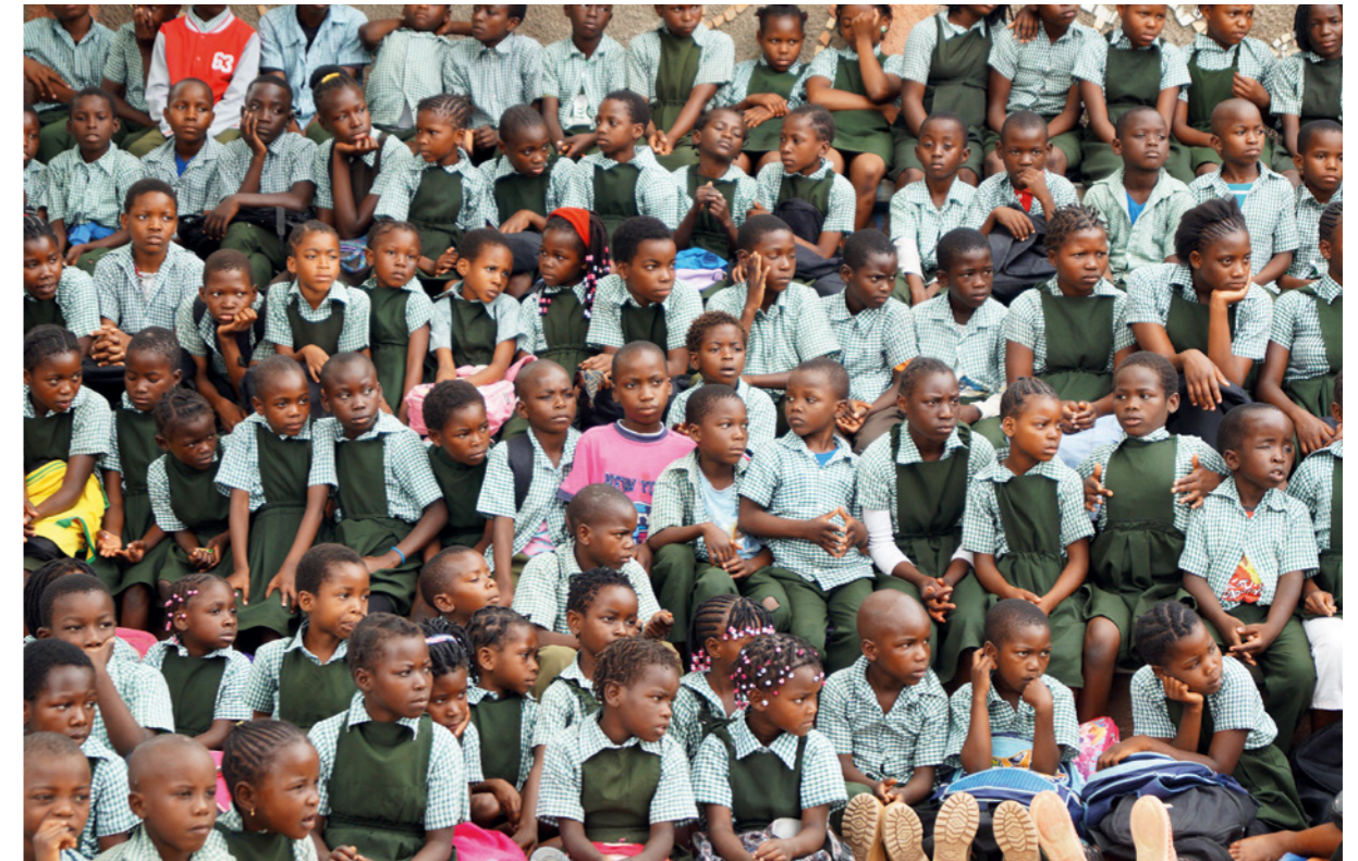
Die Schule Costa do Sol war eines der ersten Projekte der DMG in Mosambik.

Weitere Informationen finden Sie unter www.dmgev.de